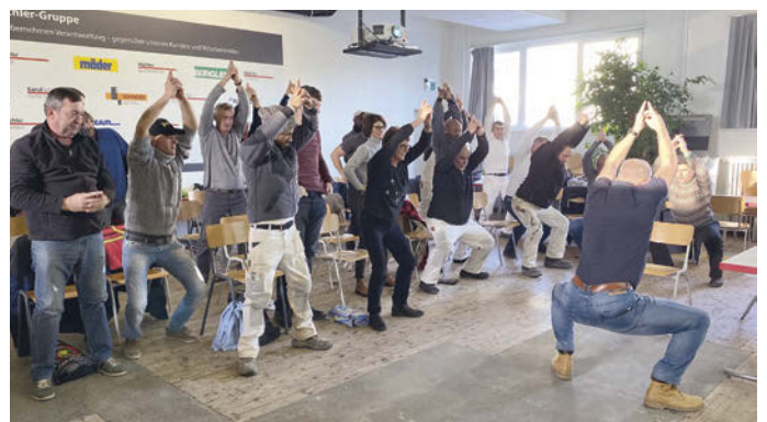
Praktische Übungen zur Reduzierung der Sturzgefahr