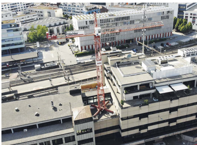
Baukran auf dem Hausdach beim Badener Postareal

Wenn es der Sache dient, stellen wir auch mal einen Baukran auf ein Hausdach. Wir sind mit den Umbauarbeiten des Badener Postareals beauftragt. Zwecks besserer und attraktiverer Erschliessung wird auf der Westseite ein neues Treppenhaus mit 8.30 m hohen Sichtbetonwänden gebaut. Die einzige Möglichkeit bei den innerstädtischen Verhältnissen und den Bahngeleisen war, den Baukran auf das Hausdach zu stellen. In Zusammenarbeit mit den Bauingenieuren haben wir dazu die Lösung erarbeitet.