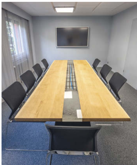
Tisch: Design und Herstellung durch das Umbau-komplett-Team

Durch die Neugestaltung wurde die Aufbruchstimmung mit unserer neuen Dienstleistung «Umbau komplett» auch gleich in den eigenen Räumen ersichtlich. Unser Umbau-komplett-Team zeichnete verantwortlich für Planung, Organisation und Ausführung. Grosszügige Arbeitsplätze, zweckmässige Einrichtungen, zukunftsgerichtete Installationen, Leichtigkeit in Farbe und Materialisierung, harmonisches Zusammenspiel von Bestehendem und Neuem wurden angestrebt und erfolgreich umgesetzt.