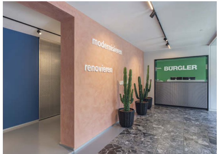
Der neue Eingangsbereich mit neuem Farbkonzept

Auch wenn die alten Pläne nicht immer das enthielten, was vor Ort angetroffen wurde, meisterten unsere Spezialisten die teils komplexen Details und Arbeitsschritte dank gutem Zusammenspiel mit Bravour. Während der ganzen Umbau-